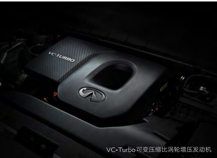
VC-Turbo可变压缩比涡轮增压发动机