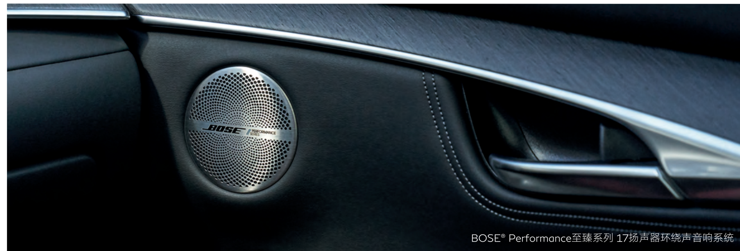
BOSE® Performance至臻系列 17扬声器环绕声音响系统

BOSE® Performance至臻系列，17扬声器环绕声音响系统，具备高级声场定位技术(AST)，BOSE® Centerpoint®2 虚拟环绕技术，BOSE® SurroundStage® 独立声场环绕声技术，以及BOSE® AudioPilot®2 噪音补偿技术。