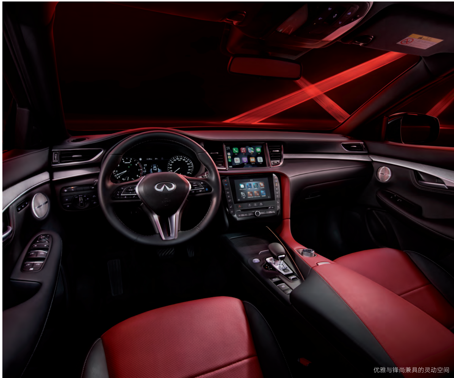
优雅与锋尚兼具的灵动空间

①本型录包括的所有图像、照片、规格、参数、文字描述系制作时可获得的最新产品信息，仅供参考，不保证本型录所描述的产品在当地英菲尼迪授权经销商处一定有售。当您选择英菲尼迪汽车产品时，请以经销商店内展示和销售的实车/实物的配置、样式、规格、颜色为准。②由于印刷色差原因，本型录显示的产品颜色可能与实物略有不同，请于当地英菲尼迪授权经销商处查看实际颜色。③英菲尼迪汽车生产厂家及其授权的总经销商有权在任何时候对英菲尼迪汽车产品的价格、颜色、材料、设备、规格和型号作出变动，包括但不限于停止生产特定车型或相关配件。④产品信息的有效性、交货时间以及可供选择的选装精品等可能因为特殊型号、产品组合和促销活动而变化，请详询当地英菲尼迪授权经销商。⑤Bluetooth® 蓝牙的商标和图标都归 Bluetooth SIG, Inc. 所拥有。⑥东风英菲尼迪汽车有限公司拥有对 Infiniti/英菲尼迪®商标、商号、产品名称和标语标识的使用权。⑦本型录于2022年8月26日起投入使用,在本型录投入使用之前,就本型录所描述的产品可能存在其他版本的介绍和描述,如有不一致之处,请以本型录为准。