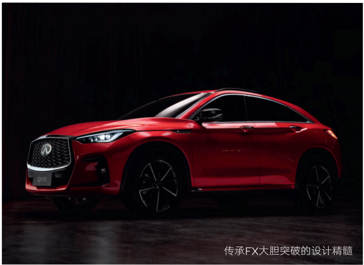
传承FX大胆突破的设计精髓