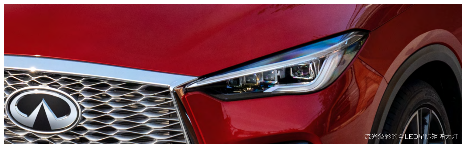
流光溢彩的全LED星际矩阵大灯