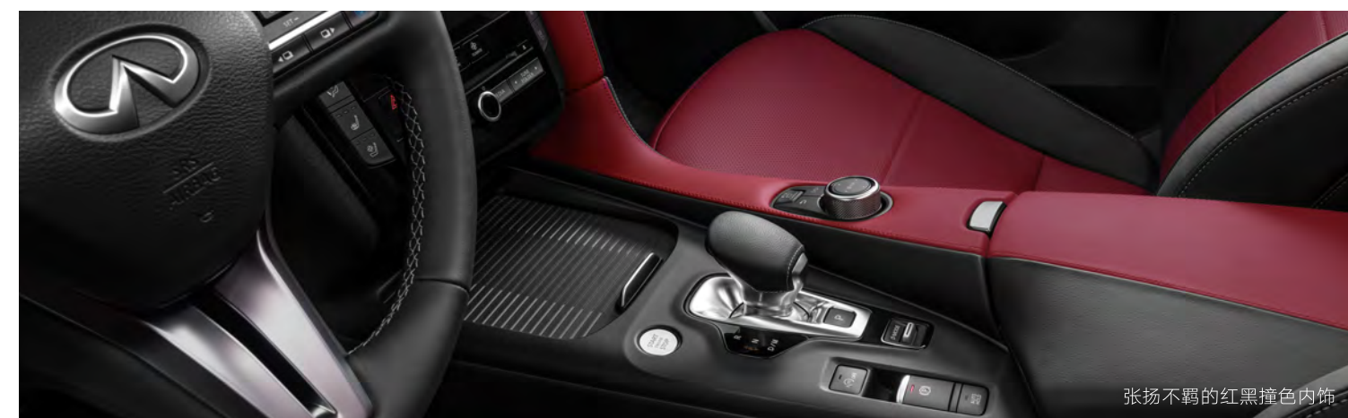
张扬不羁的红黑撞色内饰

注: • 该车型已含标准配置 — 该车型不含也不可选装配置 ◦ 该车型可选装配置