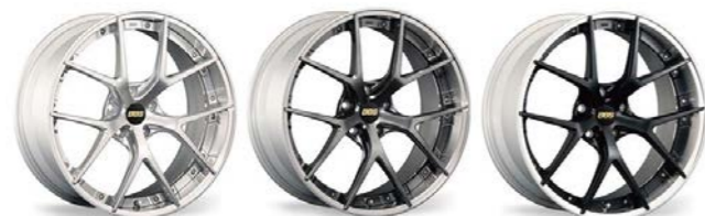
(亮银色) (亮灰色) (黑色)

零件号: Z1010IF106I002 零件号: Z1010IF107I002 规格说明: 前8.5J-RS-GT-2片式 规格说明: 后9.5J-RS-GT-2片式