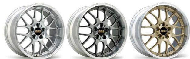
(亮银色) (亮灰色) (金色)

零件号: Z1010IF104I002 零件号: Z1010IF105I002 规格说明: 前8.5J-RI-D 规格说明: 后9.5J-RI-D