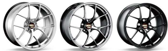
(亮银色) (亮灰色) (黑色)