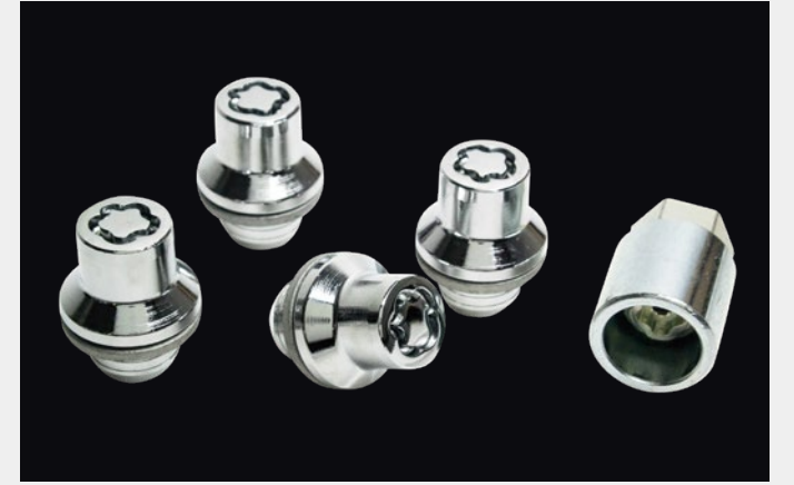
车轮防盗螺母 零件号：D0224N0002

采用5层金属耐腐蚀材质，安装简便、快捷。螺母和锁紧钥匙因其采用15种不同梅花图形设计，可降低被盗风险。