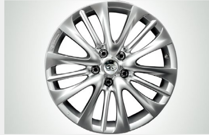
18英寸铝合金轮毂 零件号：D03001M025