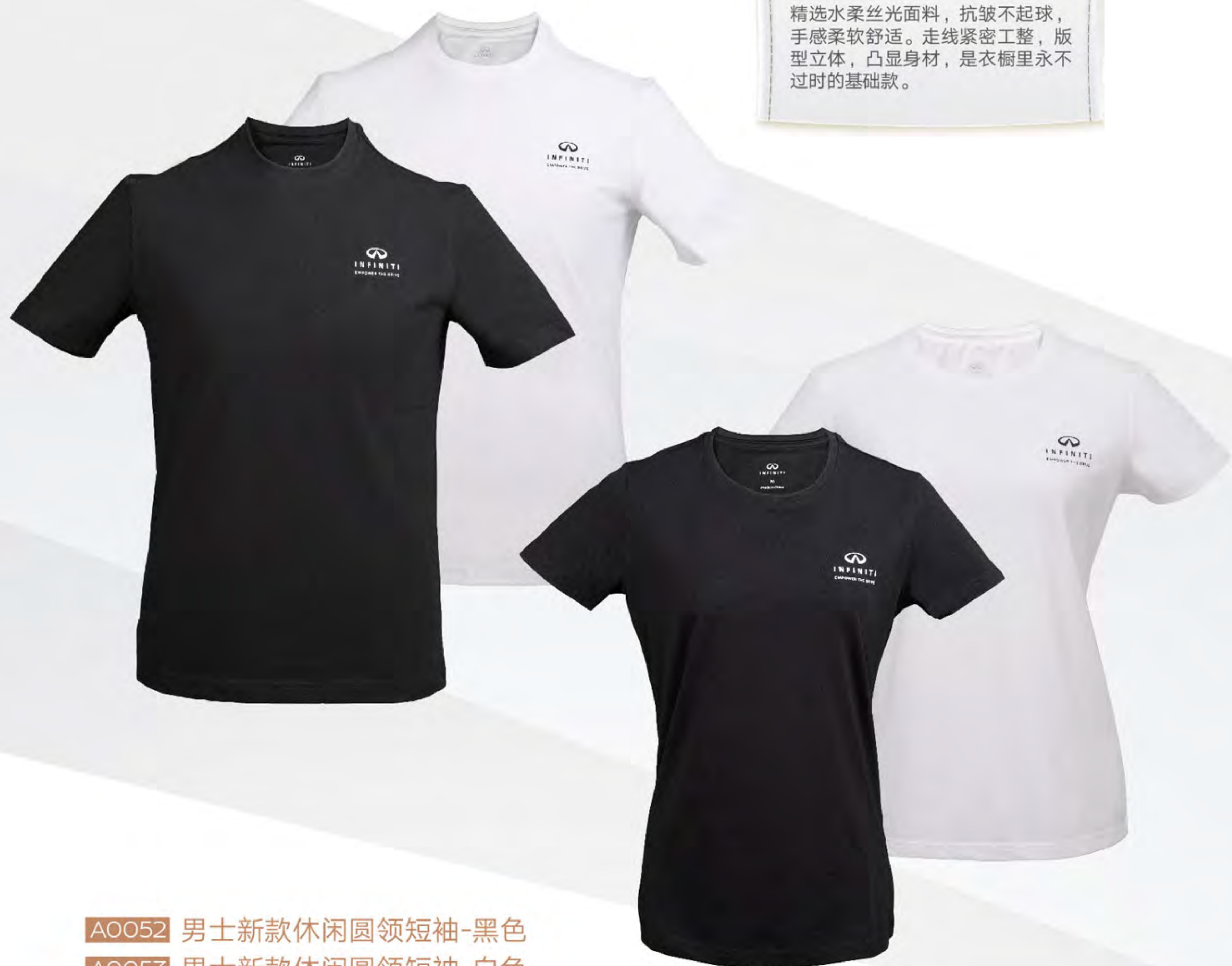
A0052 男士新款休闲圆领短袖-黑色

精选水柔丝光面料，抗皱不起球，手感柔软舒适。走线紧密工整，版型立体，凸显身材，是衣橱里永不过时的基础款。